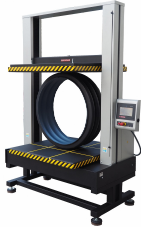
DVT GP D S100 N BORU HALKA RİJİTLİĞİ TEST CİHAZI