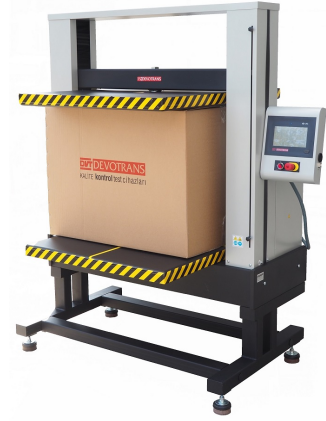
DVT GP D S80 N - KUTU EZİLME DAYANIMI TEST CİHAZI